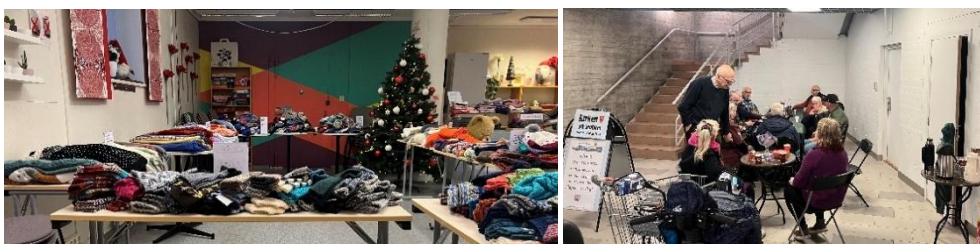
Kirken på senteret